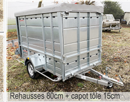
Rehausses 80cm + capot tôle 15cm